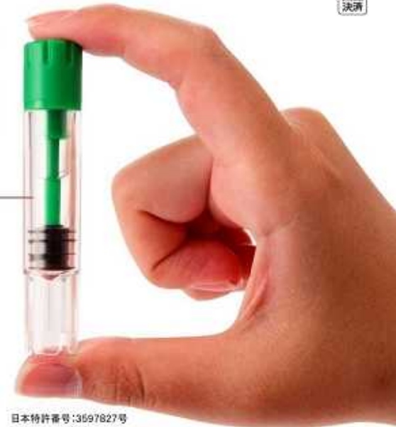
日本特許番号:3597827号 アメリカ特許番号:US6,936,473B2

検査器具は信頼の特許技術「DEMECAL血液検査」に使われている「即時血漿分離デバイス」は、日本、アメリカ、ヨーロッパで特許を取得。厚生労働省から認可を受けた信頼できる医療機器です。